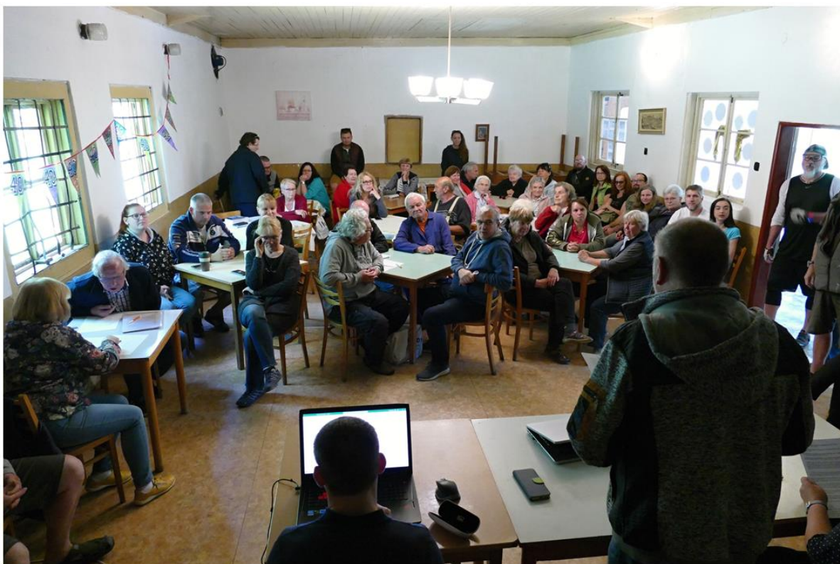
Členská schůze ve spolkovém domě dne 28. 5. 2022